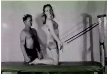
Joseph Pilates con Romana Kryzanowska